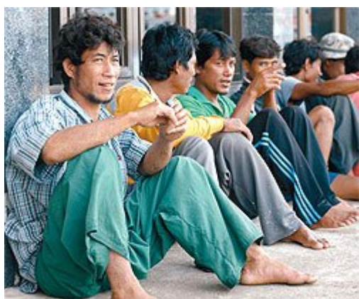
พักห้านาที: แรงงานพม่าช่วงพักจากงานที่แปลลา

ชุมชนแรงงานข้ามชาติพม่าในประเทศไทยมีประชากรประมาณ 2-3 ล้านคนประกอบด้วยกลุ่มชาติพันธุ์หลากหลาย กลุ่มแรงงานไม่กี่คนมีหนังสือเดินทาง หลายคนจากบ้านมาด้วยสภาพอ่อนล้าและสิ้นไร้ไม้ตอก เนื่องจากเผชิญสภาพบีบคั้นต่อชีวิตและเศรษฐกิจอันยาวนาน